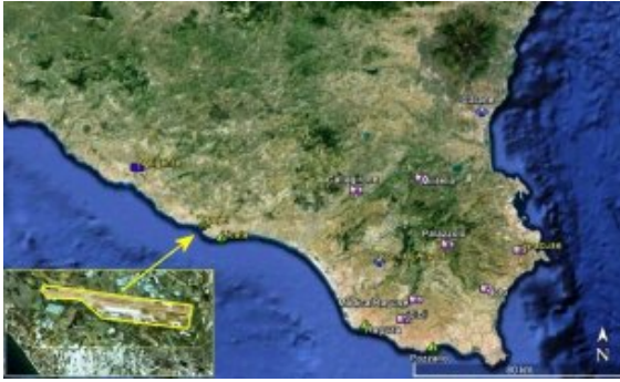
Le projet abandonné d'aéroport