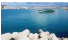
La rade immense et les fermes marines