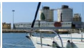
L'usine de traitement et de stockage de ciment