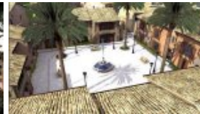
Patio ombragé du village