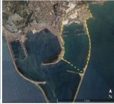
40 Ha du projet immobilier