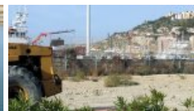
le port de pêche et les barrières infranchissables