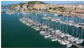
Marina vue de l'Est