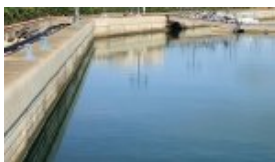
800 m de quai inaccessibles H = 1.50 m