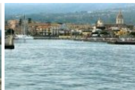
La darse au N