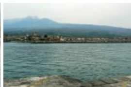
L'Etna en arrière plan