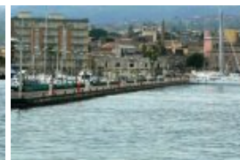
Môle N de la marina