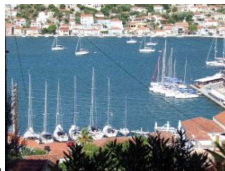
1er plan : le quai SW à droite le quai des douanes, au fond les mouillages forains