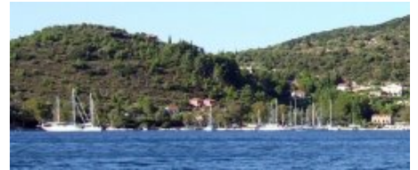
A droite le quai, à gauche les amarrages à terre