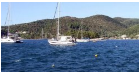
Mouillage vu depuis le NW du quai de la ville

Dans tous les cas, en saison, il faut arriver de bonne heure très prisé par les flottilles, la baie est vite pleine.