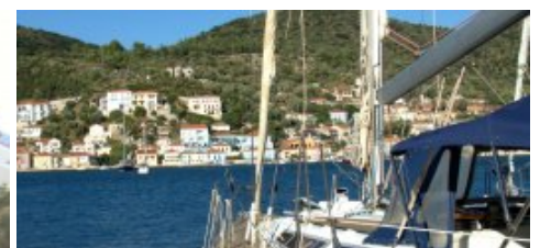
Depuis le quai SW le mouillage de Liman Vathy