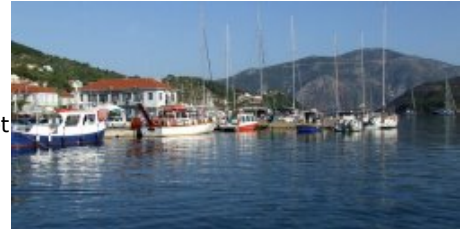
1er plan le port de pêche, et derrière, quai et bâtiment des douanes