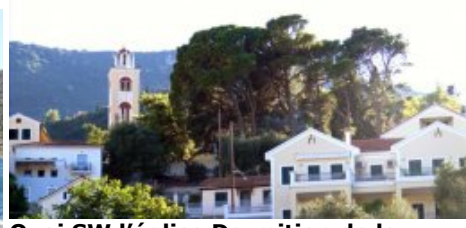
Quai SW l'église Dormition de la Vierge Marie