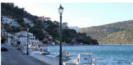
Anse NW de l'île du Lazaret

Aujourd'hui, la tradition maritime se perpétue surtout par la plaisance.