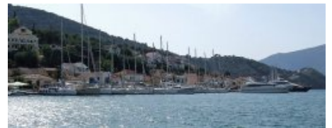
Quai de la ville, vu depuis les douanes