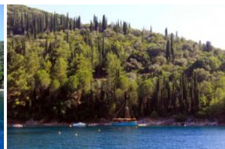
O.Skhoinos mouillage SE