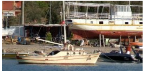
Alibey les chantier