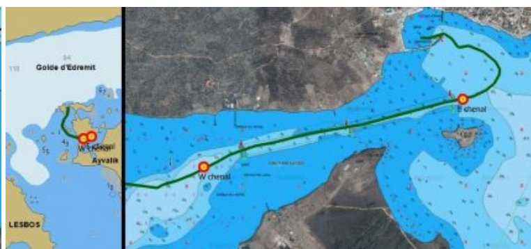
Chenal d'Alibey vue d'ensemble