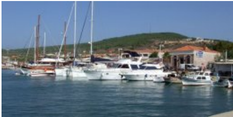
Alibey restaurants et quai NE