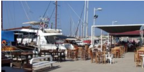
Alibey depuis le quai NE