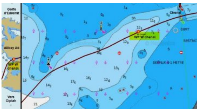
Chenal d'Alibey accès W