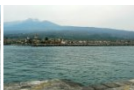
L'Etna en arrière plan