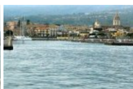
La darse au N