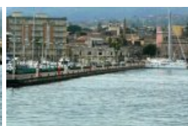
Môle N de la marina