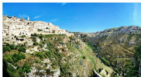
basilicata_matera5_tango7174.jpg JPEG - 88.5 ko 800 x 421 pixels